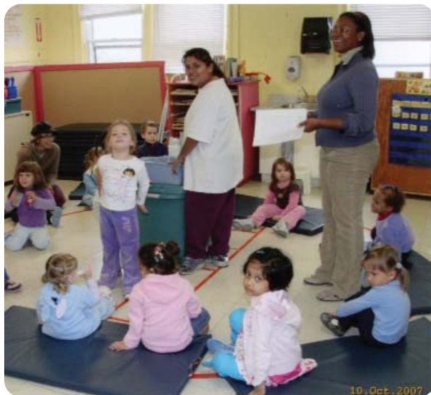
L'École Alternative - là où il n'y a jamais un moment ennuyeux - offre un bon départ à des enfants d'âge préscolaire de 3 à 5 ans de la communauté de Pointe St-Charles