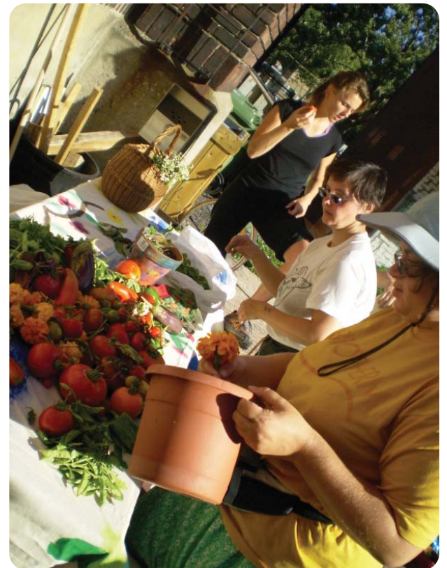
La première d'une série de récoltes du projet de jardins collectifs de la Maison Saint Columba, en collaboration avec le groupe communautaire ACSA, l'Action concertée pour la sécurité en alimentation.

L'automne est le temps de l'année où l'on fait ses provisions et où l'on remercie. À la Maison Saint Columba, nous sommes reconnaissants pour plusieurs choses cette année. Après une interruption de deux ans, nous avons remis sur pied notre camp de jour cet été. Ce fut un succès retentissant et une expérience positive pour 50 enfants et 8 moniteurs en formation, tout en offrant un emploi valorisant à plusieurs jeunes moniteurs du camp. On peut en dire autant du programme ' Hand-in-Hand ', qui a accueilli 15 adultes ayant des défis intellectuels ( suite p. 3... Chaque chose... )