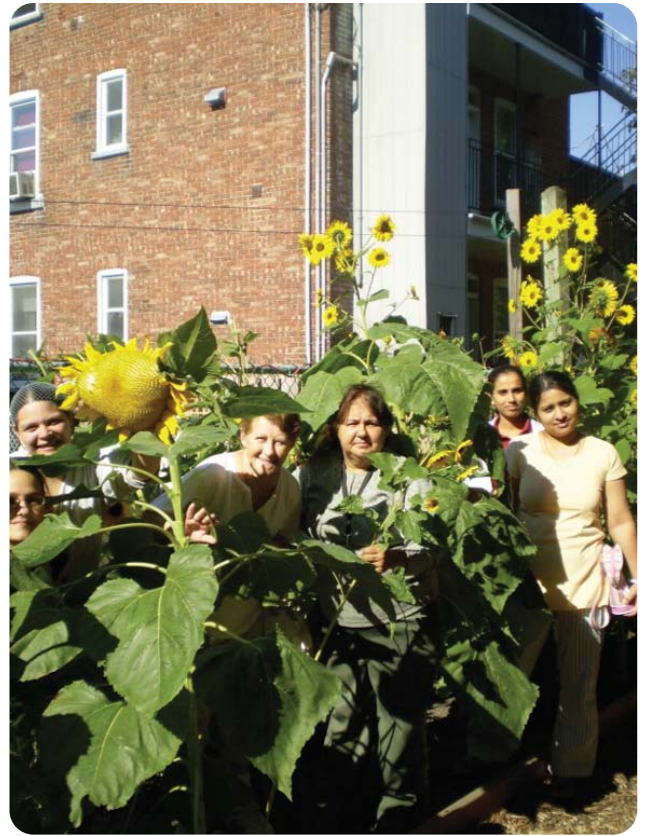
Des bénévoles sortent de leur cachette dans les tournesols! Une vue de notre jardin adjacent à l'édifice et quelques-uns des visages qui nous ont prêté main forte.

Nous avons bien d'autres projets, espoirs et rêves pour les années à venir, alors que nous continuons à chérir l'esprit d'une communauté stimulante, de tendre la main à tous en signe d'hospitalité, et à demeurer reconnaissant envers tous ceux qui soutiennent et contribuent à la réalisation de notre mission à la Maison Saint Columba.