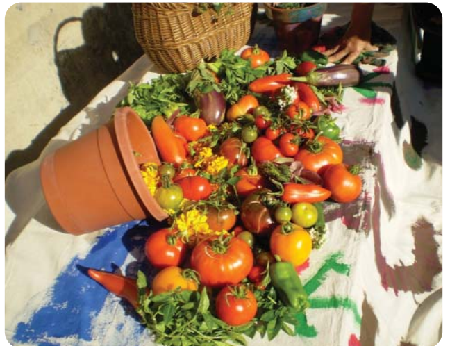
Des fruits et des légumes frais sont mis en valeur dans notre menu du programme de Dîners de la Maison Saint Columba, qui nourrit plus de 100 personnes sur une base quotidienne. Les repas sont servis chaque jour à 11h30. Tous sont bienvenus.