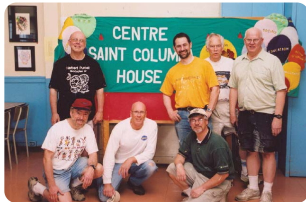
Plusieurs fois merci au Cedar Park Men's Group qui nous a aidé à repeindre nos locaux et nos corridors. Chaque année, plus de 100 bénévoles dédient plus de 11,000 heures de travail à notre ministère à la Maison Saint Columba!