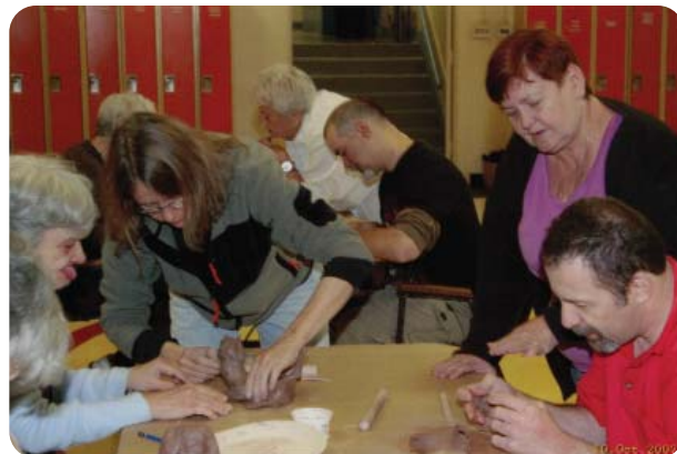
Des cours d'art hebdomadaires offrent un merveilleux exutoire à la créativité aux participants de 'Hand-in-Hand', un programme pour des adultes vivant avec des défis intellectuels.